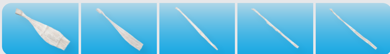
TENDÓN DE AQUILES TENDÓN DE HEMIAQUILES TENDÓN TIBIAL ANTERIOR TENDÓN TIBIAL POSTERIOR TENDÓN PERONEO