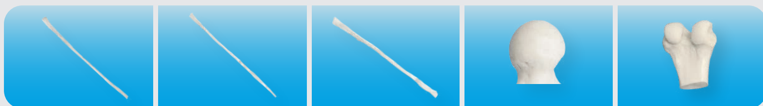
TENDÓN SEMITENDINOSO TENDÓN FLEXOR COMÚN DE LOS DEDOS TENDÓN GRACILIS CABEZA FEMORAL CÓNDILO

Nuestra cartera de productos se compone de injertos óseos con una pluralidad de presentaciones para cubrir las necesidades de una variedad de aplicaciones médicas. Nuestros productos cuentan con capacidad de osteointegración, lo que permite una regeneración y rehabilitación a corto plazo, mejorando la calidad de vida del paciente y optimizando la práctica médica del especialista.