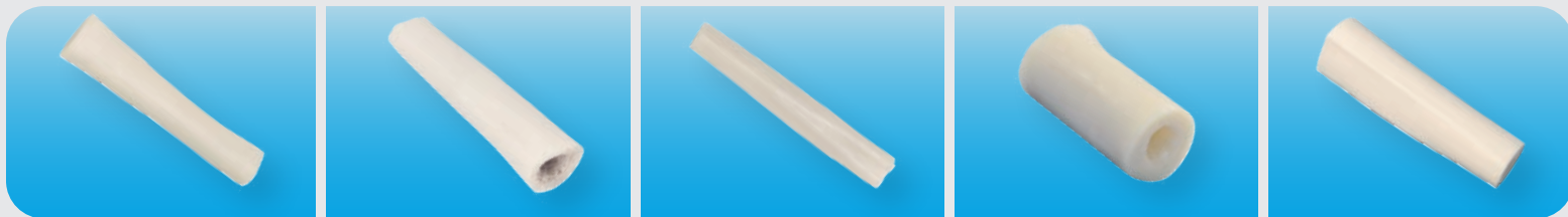
HUESO DIÁFISIS DE CÚBITO HUESO DIÁFISIS DE HÚMERO HUESO DIÁFISIS DE RADIO HUESO DIÁFISIS DE FÉMUR HUESO DIÁFISIS DE TIBIA